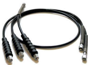
Füllschläuche mit Unimam Anschluß